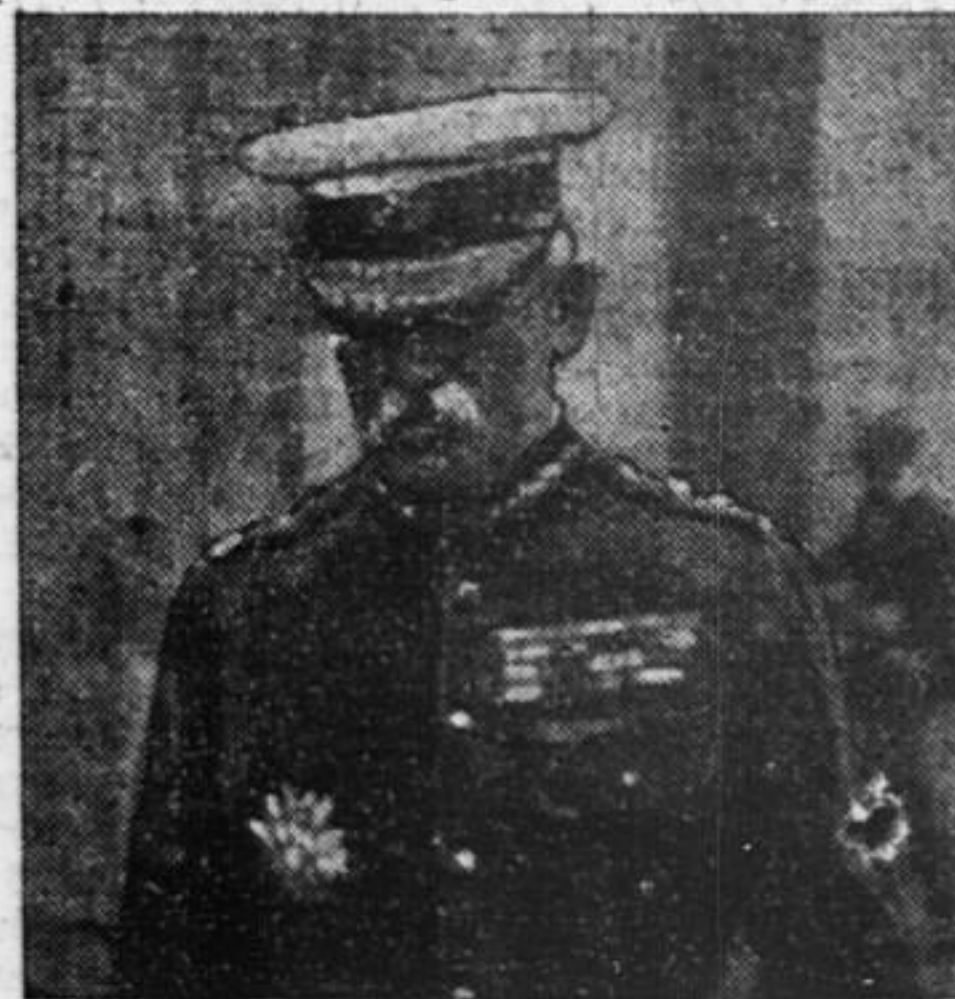
Le maréchal FRENCH

PARIS, 23 mai. — M. Painlevé a adressé ce jour le télégramme suivant à M. Baldwin, premier ministre anglais :